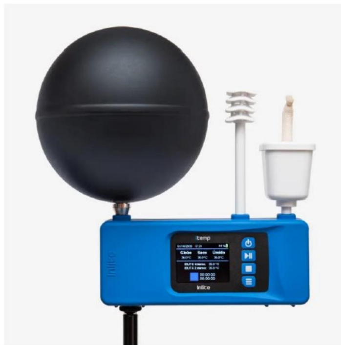
Figura 1: Monitor de Estrés Térmico (Modelo Inlite iTemp). Este equipo está diseñado bajo especificaciones ISO para integrar las tres variables termodinámicas.